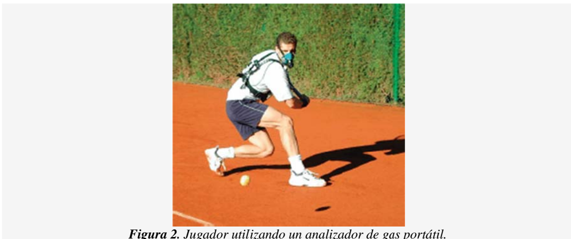
Figura 2. Jugador utilizando un analizador de gas portátil.

Recientemente Mendez-Villanueva et al. (66) reportaron concentraciones de LA más elevadas en el saque que en los juegos de retorno durante el juego de un partido de tenis real, que podrían estar relacionados con una contribución glucolítica incrementada de la actividad del que realiza el saque (esfuerzo máximo durante el primer saque) (66, 82).