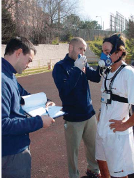
Figura 1. Ejemplo de la monitorización combinada de un jugador ( VO_2 , HR, LA, y RPE) durante una sesión de entrenamiento.

En este aspecto, la investigación (4, 43, 63) reportó que las situaciones competitivas (competencias de tenis, tenis de mesa y golf) obtuvieron incrementos sustanciales en algunos indicadores fisiológicos (presión sanguínea y HR), sugiriendo que el patrón general de efectos para la competición es también un indicador de la tensión mental incrementada y la liberación de hormonas tales como el cortisol, la adrenalina y la noradrenalina (34, 41).